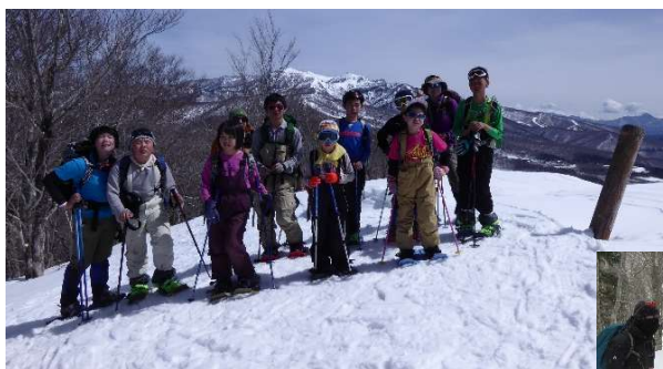
自然観察をしながら歩く