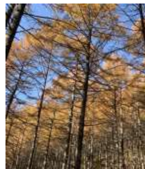
カラマツの紅葉がきれいです