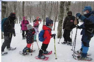
ハイキングコースの親子