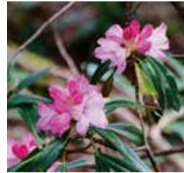
アズマシャクナゲ

県境に到着すると、長野県側の新緑のカラマツ樹林帯からのさわやかな風が吹いていて、急な登りで汗ばみ火照った体も一気に冷ましていきます。ここからは、気持ちのいい風を受けつつ多少のアップダウンをしながら大蛇倉山までの歩きです。予定より少し早く大蛇倉山に到着しました。