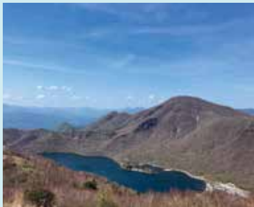
地蔵岳から望む黒檜山 (手前は大沼)

大きく裾野を広げ、群馬を代表する山として、古くから歌に詠まれ、文人墨客にも愛されてきた赤城山、今は日本百名山のひとつとしても人気が高い。特に最高峰の黒檜山は貫禄ある山容と駒ヶ岳への