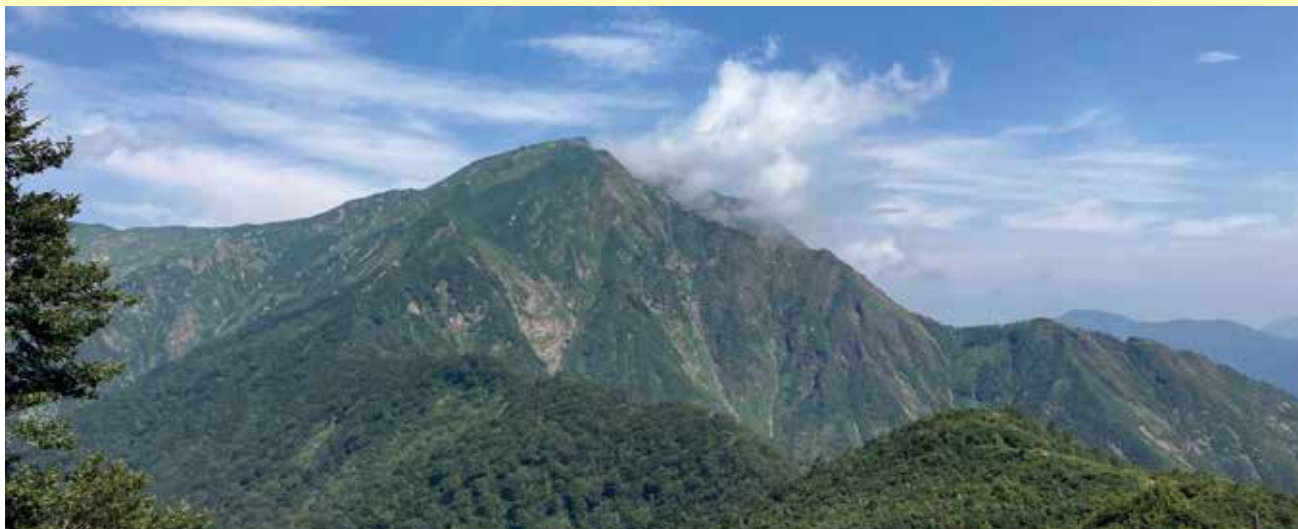
天神峠から望む谷川岳 (撮影 2022年8月)

〒371-0031 前橋市下小出町 2-46-1 (小池寛喜方) tel 027-235-9247 E-mail : info@gunmaken-sangakurenmei.net