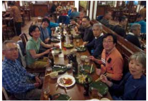
レストランでの夕食

出発を控えて、遠征報告書から当時の登山活動を振り返ると、厳しく困難な登攀が伝わってきた。全体の行動記録と遠征を終えた登山隊メンバーの文章は、隊員の熱い思いと苦闘を物語っていた。亡くなった 2 人の文章がないのは何とも辛い。次に目を通したエルゾグ著「処女峰アンナプルナ」では、フランス隊の死闘が隊員の交わす会話の中