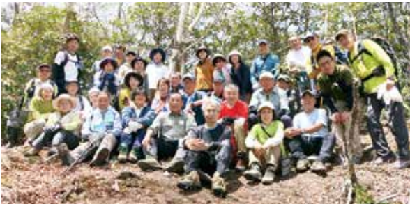
参加者で記念写真

これからも岳人ならではの魅力ある企画を自然保護委員会でしていければと考えています。そして、群馬県山岳・スポーツクライミング連盟の発展のために努力していきたいと思います。