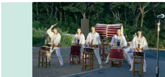
山開きの始まりを告げる三国太鼓