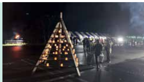
暗いうちから大勢の人で賑わう会場前

記憶では「谷川岳山開き」の日に雨に降られたことがない。7月第1日曜日という梅雨の真っ盛りなので小雨程度には降られたこともあるかと思うが、雨にたたられたという記憶がないのは、やはりこれも一つの「特異日」なのだろうか。