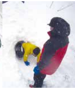
スノーマウント作成