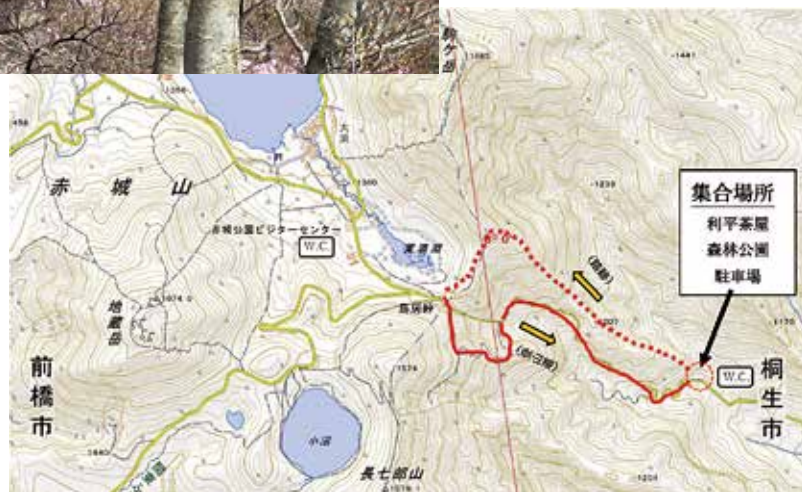
集合場所とコース概略

自 然保護委員会では、毎年1回、春から初夏にかけて自然観察会を開催しています。令和4年度の観察会は、令和2・3年度に企画しコロナ禍で中止となっていたもので、5月29日(日)、赤城山「東面の花咲く尾根」を登ります。