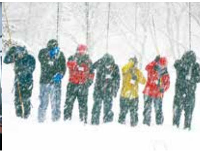
吹雪の中でのラインプローブ