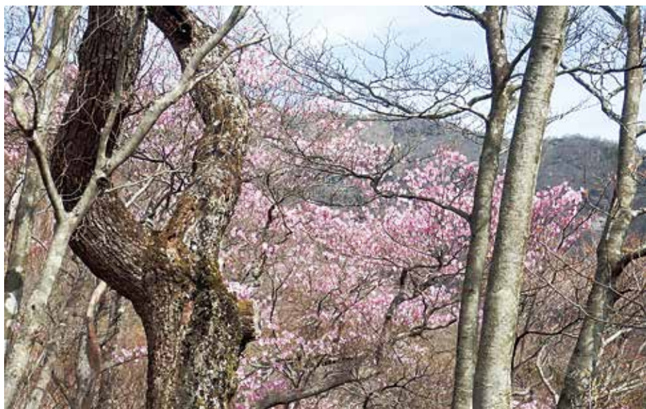
アカヤシオ咲く尾根