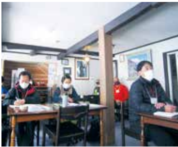
マスクと仕切りで室内講義